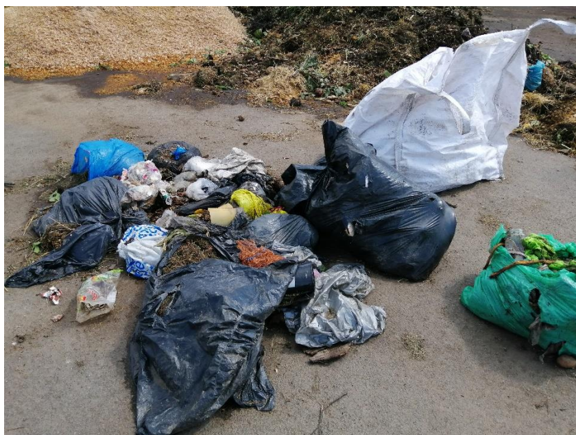
Na kompostárně Veselice, 17. 6. 2022 - vytříděné odpady z hnědých kontejnerů

Odpad z hnědých kontejnerů je odvážen přímo do kompostáren a vyrobený kompost je zapracován do půdy, proto musí být na počátku kompostovacího procesu všechny nevhodné příměsi ručně vytříděny. Vybírat při letních teplotách z rozkládajících se odpadů rostlinného původu odpady není nic, co byste chtěli každý týden provádět. Proto vkládejte do hnědých kontejnerů jen odpady rostlinného původu! Na nádobách je uvedeno, co do nich patří. Rostlinné odpady ukládejte bez plastových pytlů, rostliny a květiny vysypávejte z květináčů a truhlíků.