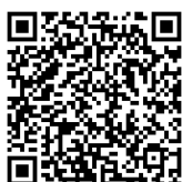
QR kód iOS