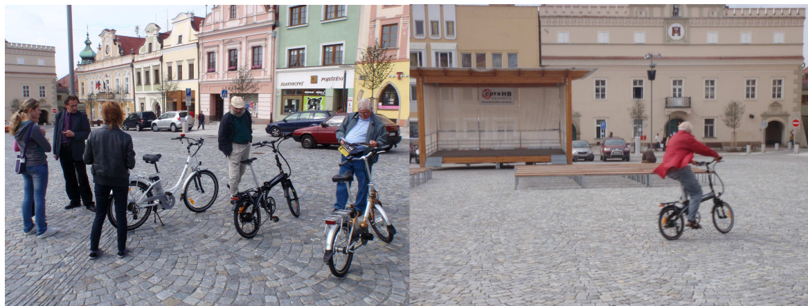
elektrokola na náměstí