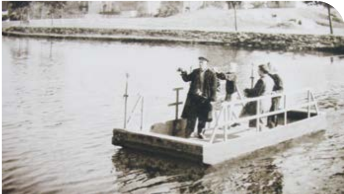
Přívoz na Sázavě u městských jatek přepravoval pasažéry v letech 1944–1946

Dopravní situace v Brodě je v současnosti poněkud komplikovaná, řečeno velmi diplomaticky a ještě minimálně rok bude tento stav trvat. Stačilo uzavřít jeden ze dvou silničních mostů přes Sázavu a doprava se téměř vrátila o několik desítek let do minulosti.