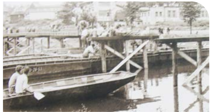
Druhou dřevěnou lávku v roce 1959 vybuvovali armádní ženisté z Jindřichova Hradce

Přesto se veřejnosti, především z předměstí kolem Humpolecké ulice, aby si mohla zkrátit cestu do města, dostalo na konci okupace skromné náhrady. V roce 1944 byl zřízen u městských jatek osobní přívoz. Jednoduché zařízení vodícího a přisuvného lana přepravilo pramci s cestujícími spolehlivě na druhý