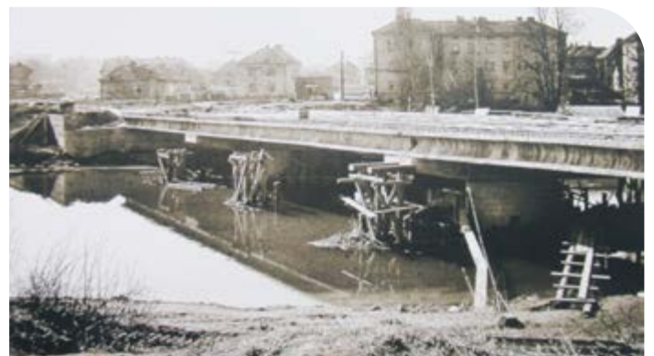
Právě položená mostovka nového silničního mostu, který byl dokončen v roce 1968