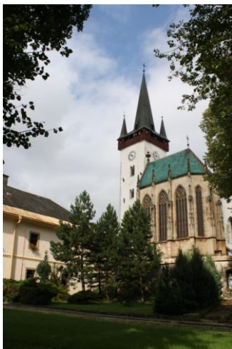
Domovina, Žehra - část Hodkovce

Hlavním cílem tohoto projektu je odstraňování bariér mezi majoritní společností a klienty zejména pobytových sociálních zařízení.