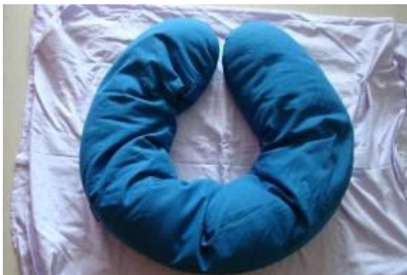
Obrázek č. 1 Podkova k polohování

pomůžou zavést tento ošetrovatelský koncept do naší praxe v Domově pro seniory Reynkova a tím zkvalitnit poskytované služby v našem domově. Domnívám se, že celý projekt přinesl mnoho zajímavých poznatků, které můžeme aplikovat do naší praxe. Přinesl též mnoho nových osobních a pracovních kontaktů mezi pracovníky v sociálních službách na SR a v ČR, které budou pokračovat i nadále.