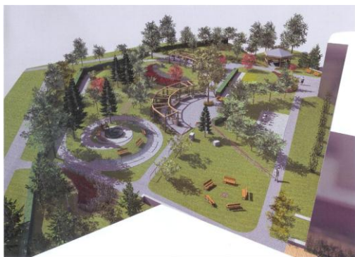
Vizualizace zahrady smyslového vnímání v Domově seniorů Reynkova