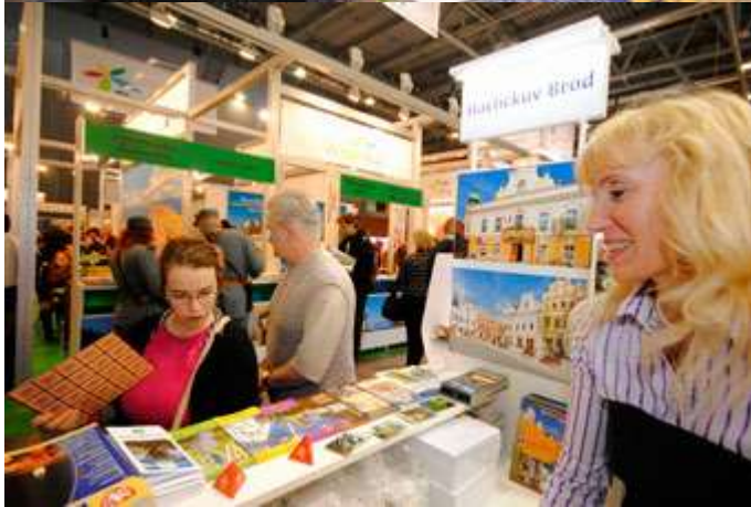
Holliday World Praha - únor 2012