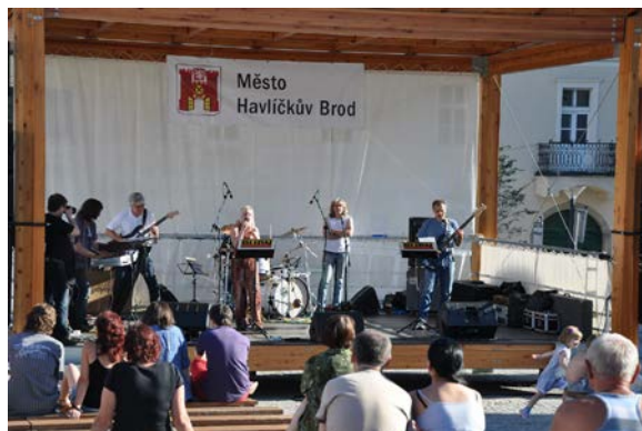
Nedělní koncert skupiny BURN – 21.07.2013