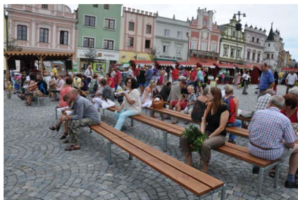
Trh řemesel – srpen 2012