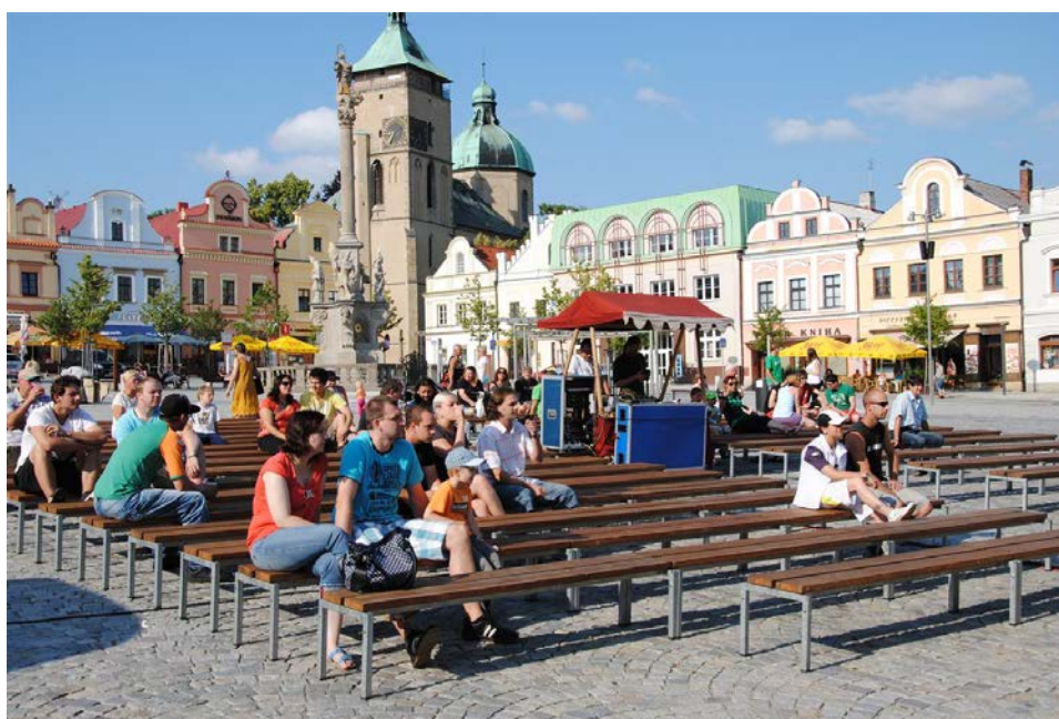
Návštěvníci Havlíčkova náměstí během koncertu El'BRKAS – 7.7.2013