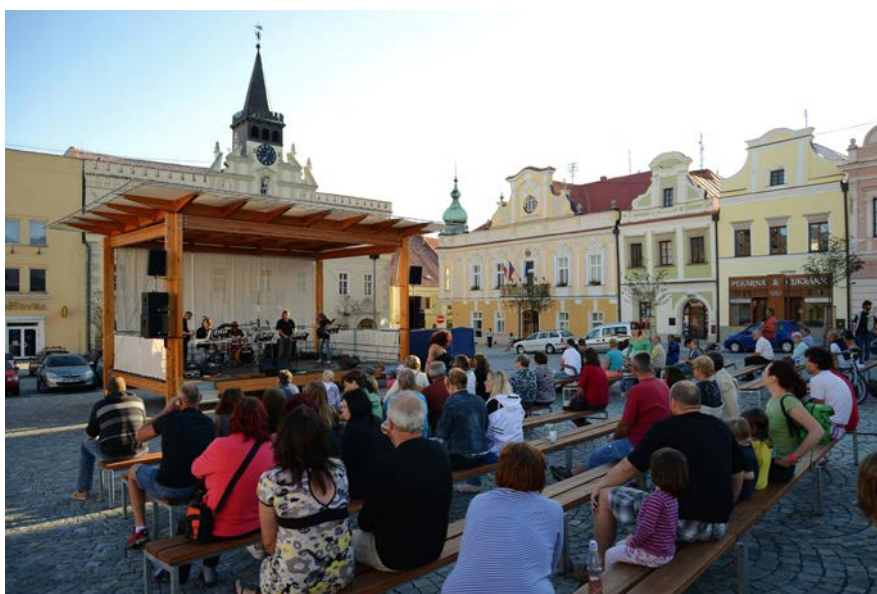
Koncert skupiny EMIL

Letní scéna slouží především k hudební a divadelní produkci v rámci Havlíčkobrodského kulturního léta a nedělních koncertů