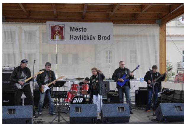
Koncert skupiny DIO FIVE GUITARS – 30.06.20