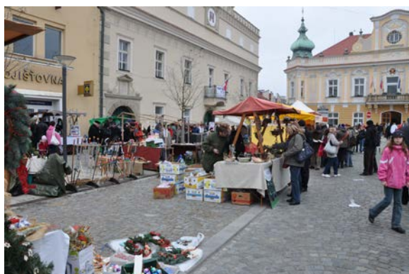
Trh řemesel - listopad 2012

K pravidelným akcím patří např. Majáles, vánoční, řemeslné a farmářské trhy či promítání letního kina a nedělní koncerty. Každou středu probíhají akce v rámci Havlíčkobrodského kulturního léta 2013.