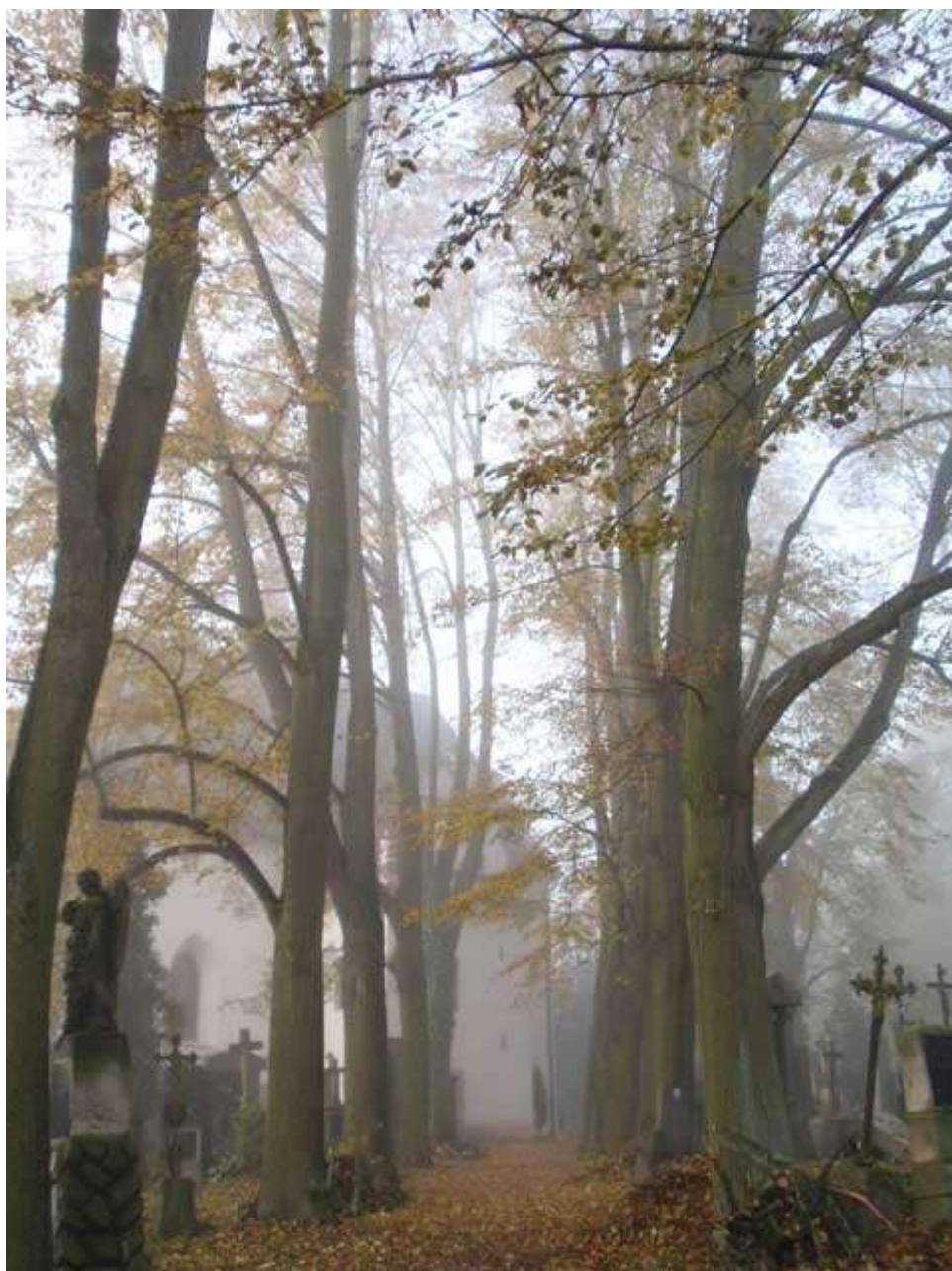
Pohled ze severní strany do ošetřené lipové aleje s průhledem na kostel sv. Vojtěcha - ze dne 30. 10. 2009.