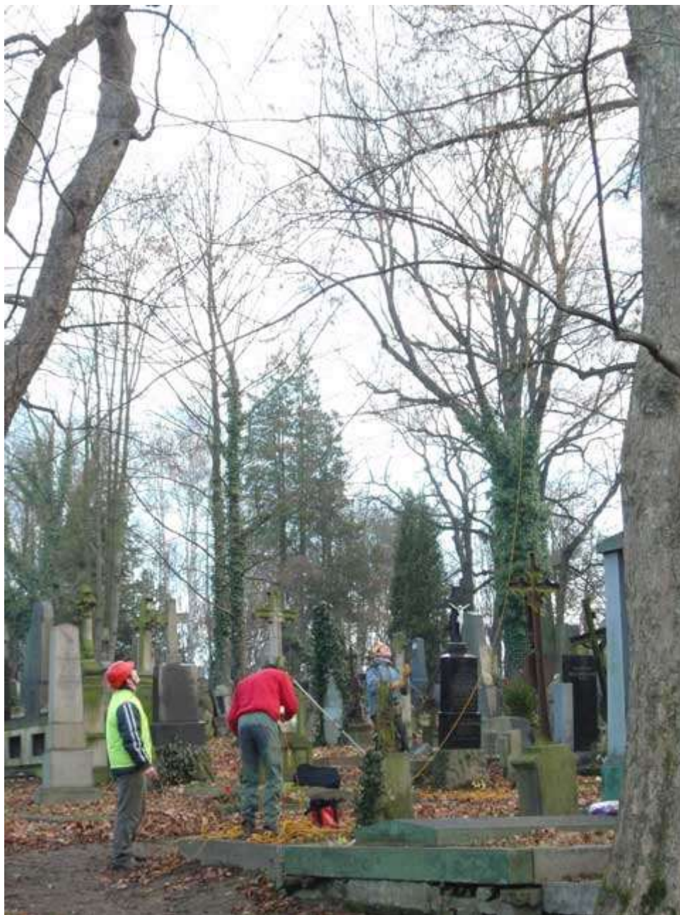
Příprava arboristů na hřbitově sv. Vojtěcha na výstup do korun stromů - ze dne 26. 11. 2009.