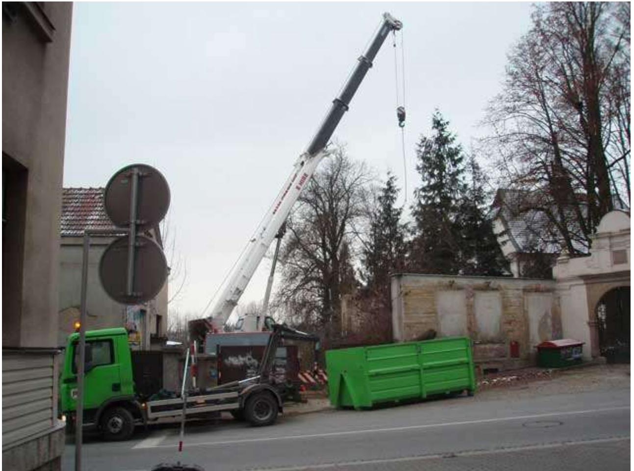
Kácení dřevin a nakládka dřevní hmoty ve ztížených podmínkách pomocí jeřábové techniky - dne 14.12.2009.