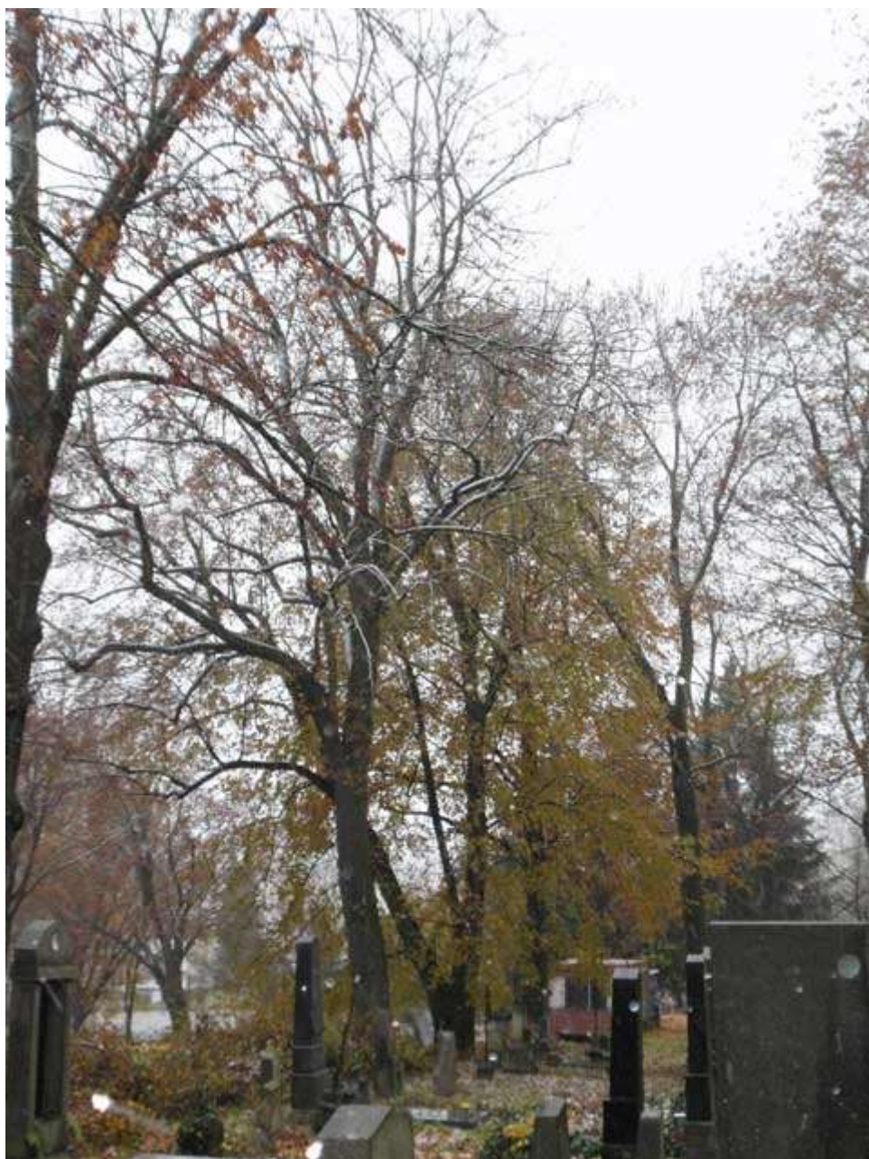
Hřbitov sv. Vojtěcha dne 3. 11. 2009 a pohled na sklad větví v jižní části hřbitova.