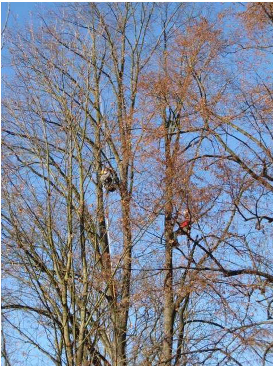
Arboristé provádějící řez v korunách stromů - ze dne 26. 11. 2009.