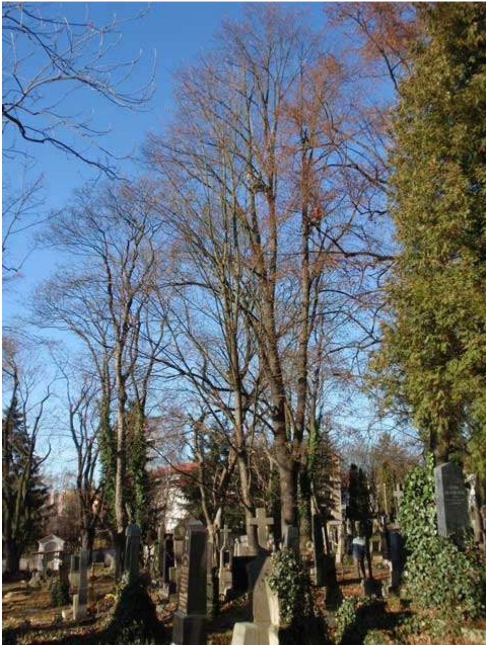
Arboristé provádějící zdravotní řez v korunách vzrostlých lip - ze dne 26. 11. 2009.