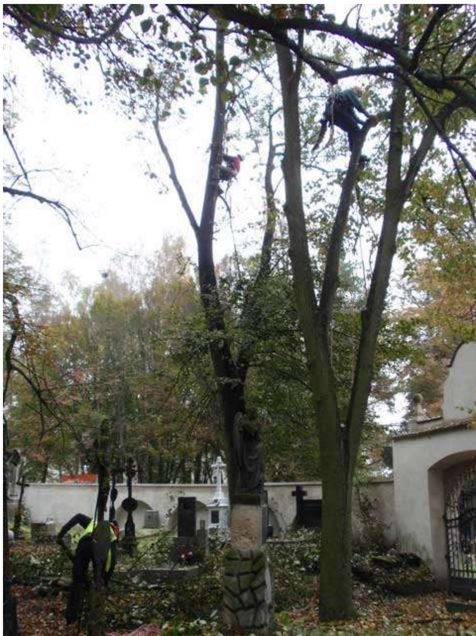
Ošetření dřevin v severní části hřbitova dne 20. 10. 2009.

řezů, ošetření poranění, stažení a zabezpečení kosterních větví preventivními bezpečnostními vazbami.