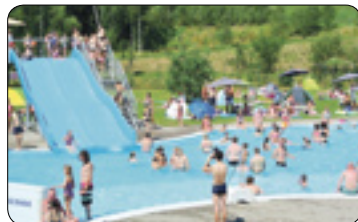
1. srpen na koupališti (str. 4)