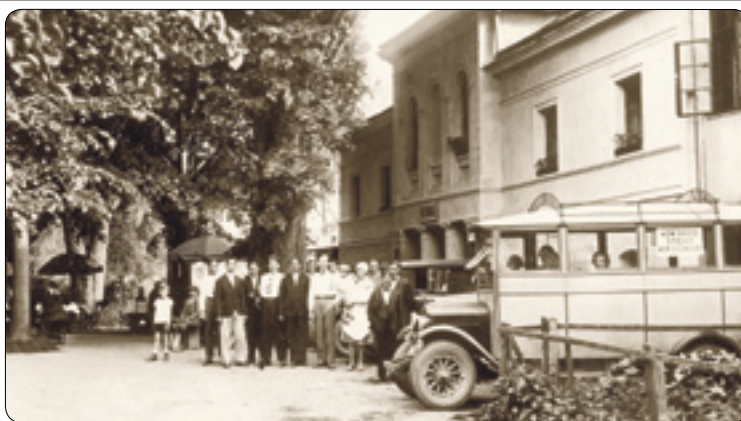
V sezoně bývalo v petrkovských lázních rušno. Jak vidno zajižděl sem i autobus na lince Německý Brod – Německý Šicendorf (dnes Dobronín).