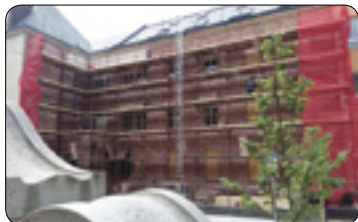
Gymnázium Havlíčkův Brod v rekonstrukci (str. 3)