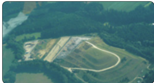
Skládka Ronov nad Sázavou

portálu www.nevyhazujto.cz , kde můžete po zaregistrování nabídnout zdarma za odvoz cokoli, zejména nábytek, kuchyňské nádobí, elektroniku, knihy, oblečení, sportovní potřeby, hračky atd.