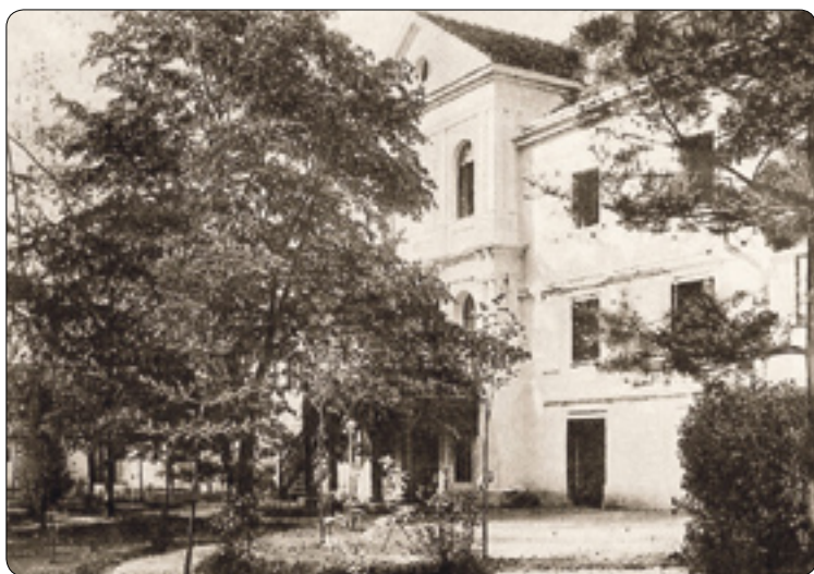
Pohled na lázně z dokonale upraveného parku, který lákal k procházkám.