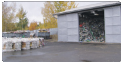
Třídící linka TSHB

Město je pro zajištění opětovného použití zapojeno do