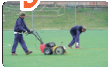
Na Losích se bude zelenat nový trávník (str. 6)