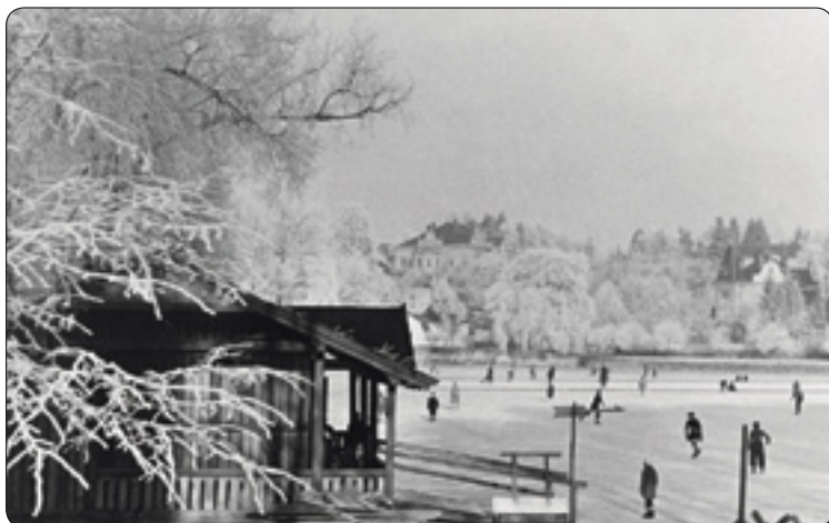
Upravené zimní kluziště na Hastrmanu v třicátých letech. Vlevo je vidět část dřevěné ohřívárny, zlikvidované v roce 1974