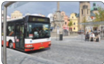
MHD o Velikonocích (str. 3)