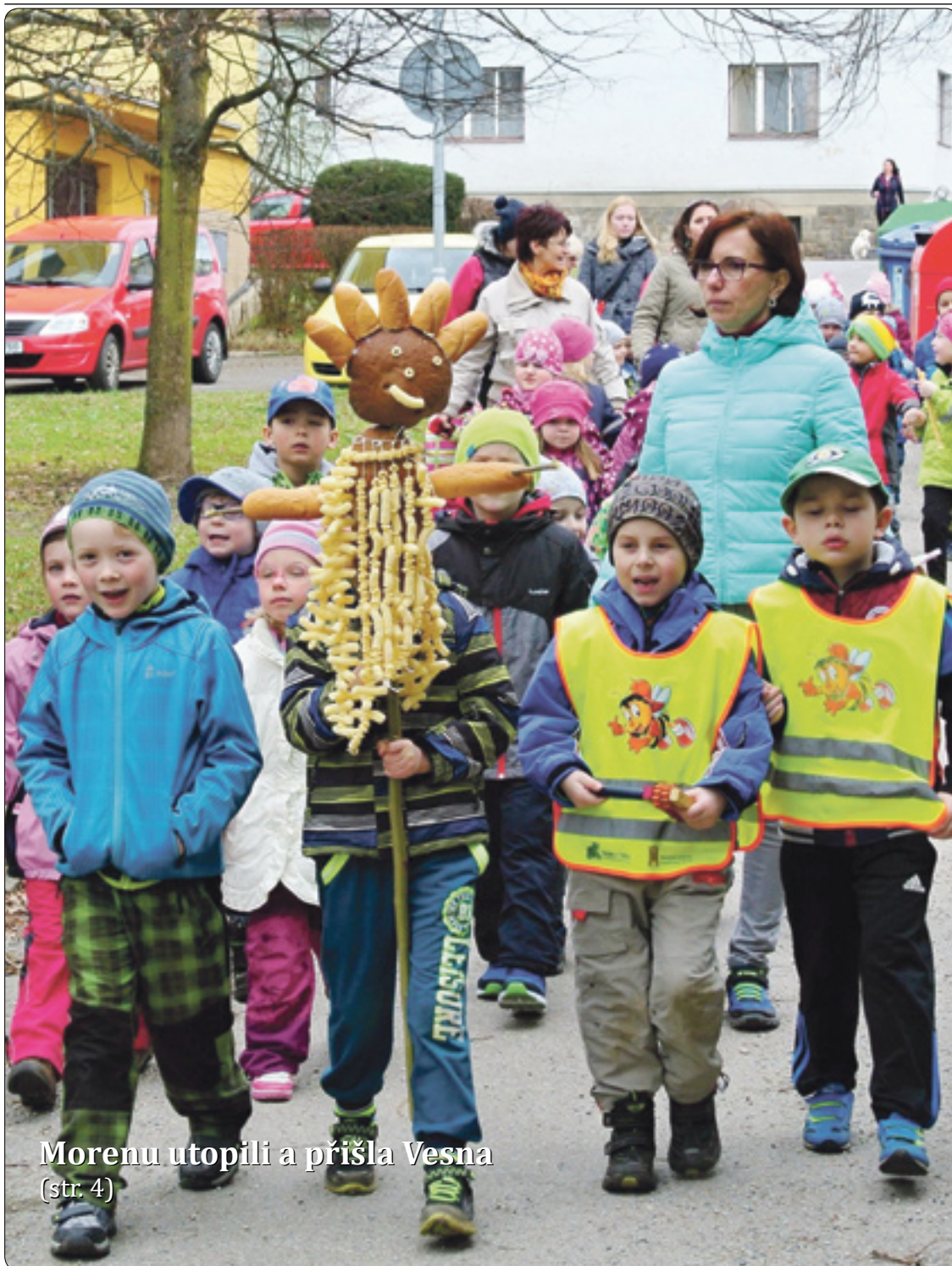
Morenu utopili a přišla Vesna (str. 4)