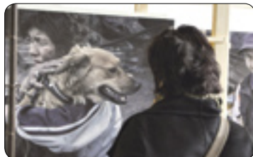
Výstava Jindřicha Štreita (str. 4)