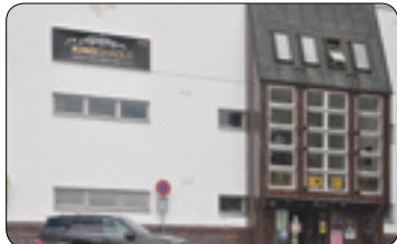
Město bude mít 100% kontrolu nad Kínem a divadlem Ostrov (str. 3)