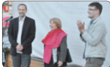
Výročí Karla Havlíčka Borovského (str. 4)