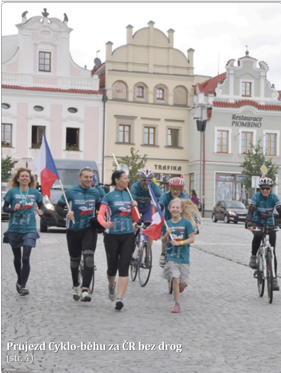
Průjezd Cyklo-běhu za ČR bez drog (str. 4)