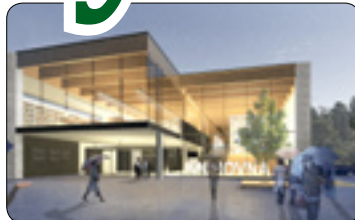
Intenzivní jednání okolo krajské knihovny (str. 8)