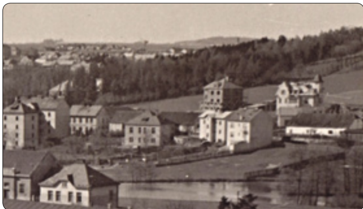
Rackova vila v doposud malé zástavbě podél Žižkovy ulice, kolem roku 1935

To ale mluvíme o ulici, ale ne o celé oblasti. Na počátku dvacátého století spadala tato část adresně pod Dolní město (levá strana řeky Sázavy a východně od hradeb města). Ale pro místní obyvatele obecně efektivněji fungovaly spíše názvy orientační: na Letné, na Kokoříně, na Žabinci, na Stráži nebo prostě u nádraží. To byla tradičně užívaná lidová pojmenování, aby se vědělo, kde