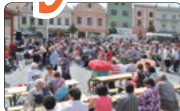
Léto ještě nekončí (str. 8-9)