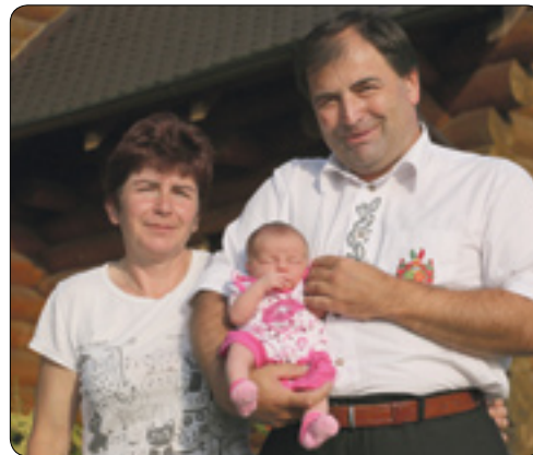
Votavovi s prvním vnoučátkem

Vztah k lesnictví, myslivosti a k práci v přírodě má tento havlíčkobrodský rodák v genech. Otec byl lesní inženýr a dědeček hajný. Jako dělník vykonával především manuální práci v JZD. „Tato práce mě bavila, protože v mládí má člověk přece jenom jinou fyziku než dnes. Tenkrát mi námaha vůbec nevadila, bral jsem to spíš jako sport. Dodnes jsem rád, že jsem tento způsob života poznal. Lidé, kteří pracují manuálně, mohou mít v podstatě šťastný a klidný život. Odpracují si to své, a pak mohou jít s čistou hlavou domů.“ V současné době už ovšem pracuje hlavně duševně, což je podle něj mnohem náročnější. „Dnes ráno jsem si kosou už jen tak pro radost posekal kus pozemku,“ dodává.