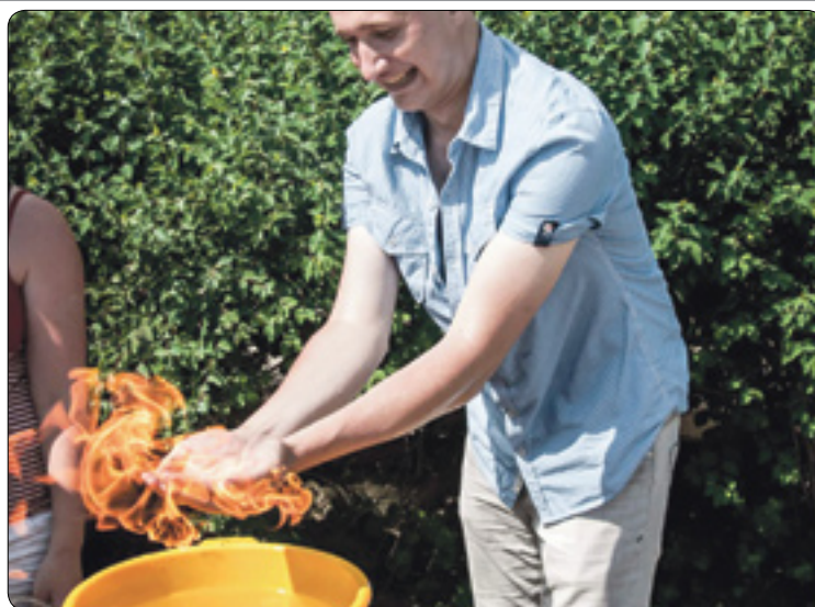
Fyzikální experimentování na školní akademii

zveme do školy všechny, kteří se chtějí podívat, jak to na gymnáziu funguje. Speciální program je připraven pro zájemce o studium z řad žáků a rodičů pátých a devátých tříd, žáci si mohou vyzkoušet první verzi přijímacích zkoušek nanečisto, rodiče budou moci debatovat s vedením školy.