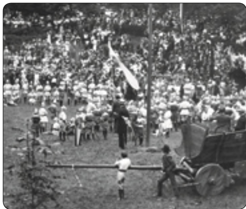
Husité před Naumburkem, scénka z Dětského dne v Kotlině 5. 7. 1914.