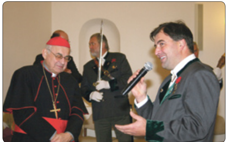
Setkání s kardinálem Vlkem