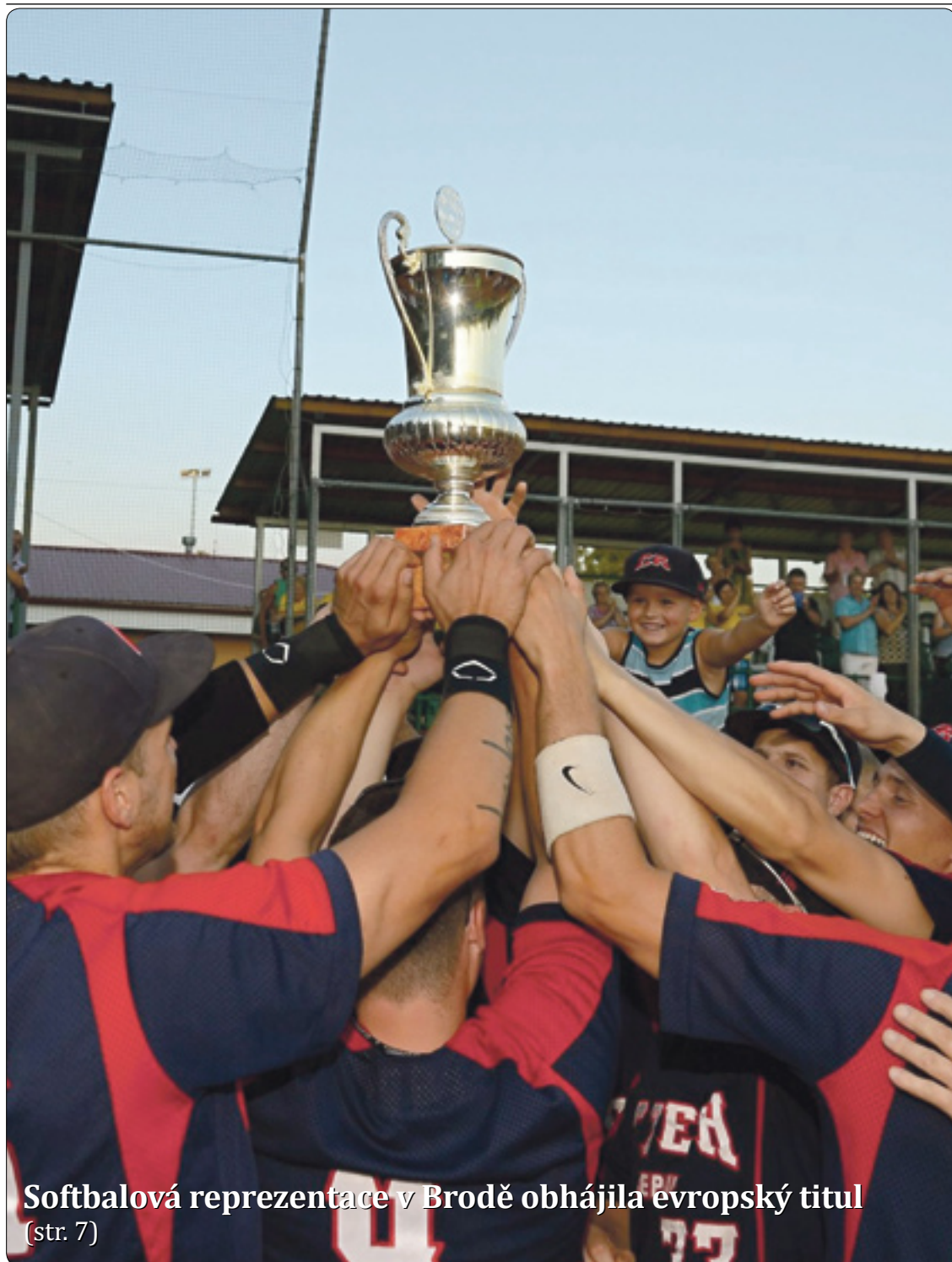
Softbalová reprezentace v Brodě obhájila evropský titul (str. 7)