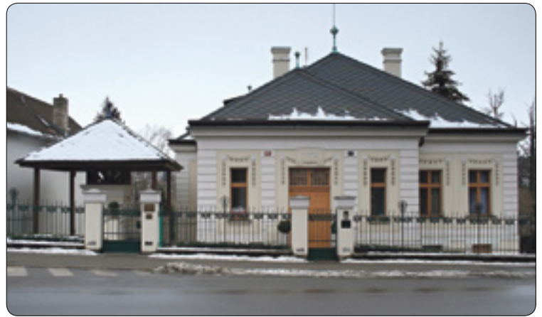
Vila čp. 226 v roce 2009

dotyčný bydlí. Pokud Žižkov dostal název po Žižkově ulici, v případě Pohledské tomu tak nebylo. V době, než Žižkov vznikl, se této oblasti minimálně od poloviny sedmáctého století říkalo „mezi vodami“, „na Karlově“ nebo prostě „Karlovo“. A právě vila čp. 226 je dnes poslední nejviditelnější připomínkou tohoto starého zapomenutého názvu.