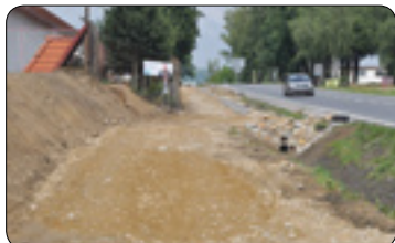
Cyklostezka do Šmolov se už rýsuje (str. 3)