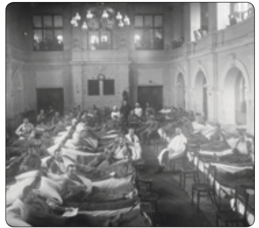
Stará sokolovna (dnes klub Oko) se změnila ve vojenský lazaret.

Podobně jako na jiných místech i v Brodě se počítalo se zřízením filiální nemocnice pro raněné. Původně pro ni byla vyhlédnuta budova školy II. obvodu (dnešní stará budova gymnázia). Aby však mohla nerušeně začít v září výuka, plán doznal změny. Pobočka okresní nemocnice byla nakonec instalována v budově sokolovny. Kancelář výboru posloužila jako operační sál, v osmi dalších místnostech bylo postaveno celkem 100 lůžek pro pacienty. Kuchyně se ale do sokolovny již nevešla a obsadila přístavek staré divadelní budovy přes ulici. Do prvního kursu Červeného kříže pro ošetřovatelky se dobrovolně přihlásilo 37 místních žen. Vedl jej sám ředitel nemocni-