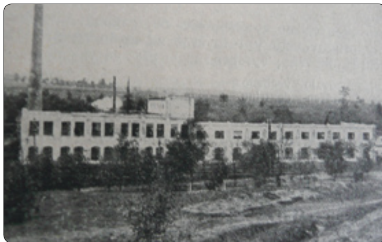
Pohled na škrobárnu bez pozdějších přístaveb přes poličskou silnici a železnici na počátku dvacátých let minulého století.