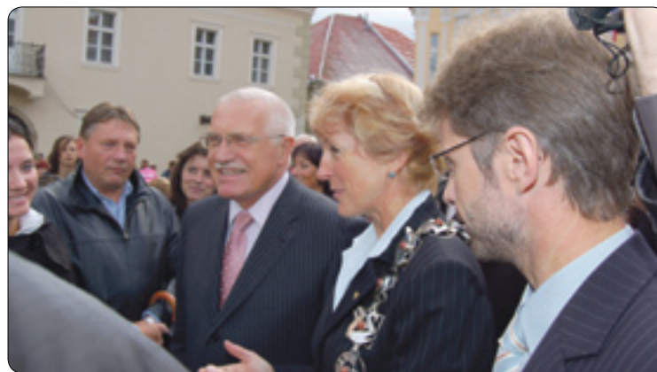
Havlíčkův Brod navštívil jak prezident Václav Havel, tak v roce 2007 prezident Václav Klaus.