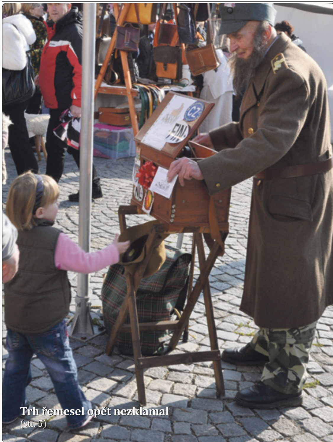
Trh řemesel opět nezklamal (str. 5)