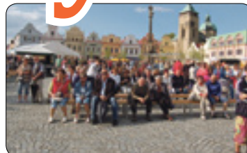
Kam sahají síť odboru vnějších a vnitřních vztahů (str. 8-9)