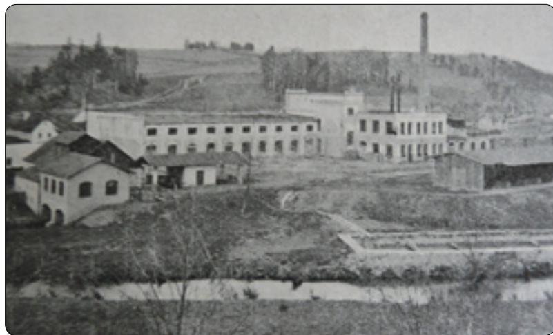
Zajímavý pohled na škrobárnu přes Sázavu od cesty na Termesivý. Při levém okraji je ještě patrná skupina staveb bývalého mlýna i část původního náhonu.

Za typickou fasádou fronty továrních budov bývalé škrobárny v osadě Pohledští Dvořáci bychom dnes asi těžko mlýn hledali. Ovšem prostor to byl od nepaměti jako stvořený k zřízení jakéhokoliv podniku využívajícího vodní sílu. Sázava v těchto místech modeluje nepříliš široký zákrut s poměrně rovným terénem. První písemná zmínka o majetkovém převodu mlýna pochází z r. 1540. Tehdy při něm ještě měl stát hamr, což je informace velmi zajímavá. Mohla by jeho vznik posunout o nějakých pár set let do minulosti, snad až do éry středověké těžby stříbrné rudy. Podle předního znalce dolování na Havlíčkobrodsku Mgr. Pavla Rouse by mohl námi vydedukovaný hamr ležet uvnitř jednoho z okrsků intenzivní těžby, v němž byly zachyceny i stopy po zpracování železné rudy. Od toho se samozřejmě nabízí asociace předpokládaného hamru jako podniku založeného k výrobě hornických nástrojů. Zatím se však v tomto případě pohybujeme na půdě čirých hypotéz, doklady, které by datovaly jeho tak raný vznik, chybí. Do jaké doby byl hamr v provozu, není jisté. Pravděpodobně před polovinou 16. století již postrádal na důležitosti, ba zda vůbec ještě pracoval. Nicméně dal název mlýnu i budoucí osadě Hamry, která se od r. 1850 stala součástí politické obce Pohledští Dvořáci, jež byla o více jak sto let na to připojena k našemu městu.