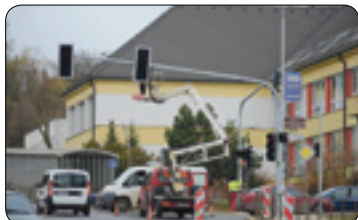
Chytrý semafor na křižovatce Husova-Masarykova (str. 3)