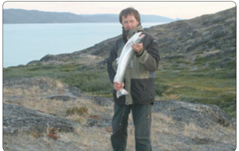
S úlovkem u grónského fjordu