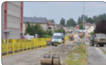
Uzavírka Žižkovy ulice (str. 3)