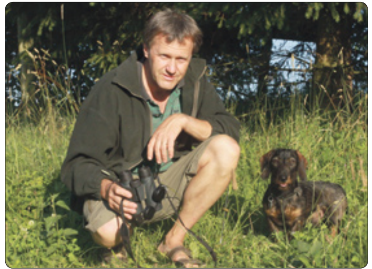
V přírodě s jezevčikem

město z úplně jiné stránky, než jsou zvyklí. Na začátku je ještě úplná tma, poté se rozednívá, ptáci začínají zpívat, a protože nejsou rušeni dopravou a jinými ruchy města, lidé se k nim mohou dostat velmi blízko.“