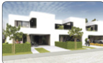
Takové bydlení bychom chtěli (str. 8–9)