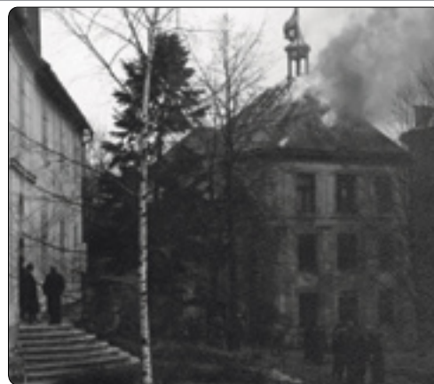
Osud Barborky se začal naplňovat po dalších více jak padesáti letech. Když ji 13. 3. 1943 zachvátil požár a shořela střecha i s krovky, byla poté ještě provizorně zakryta. Neprospěly jí ani výbuchy spojeneckých bomb 15. 11. 1944 v její blízkosti, které jí otřáslly v základech a po nichž zůstala stejně jako sousední budova bez okenních skel. Po osvobození byla zchátralá budova v r. 1945 zbourána.