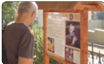
Nová stezka Bohuslava Reynka (str. 5)