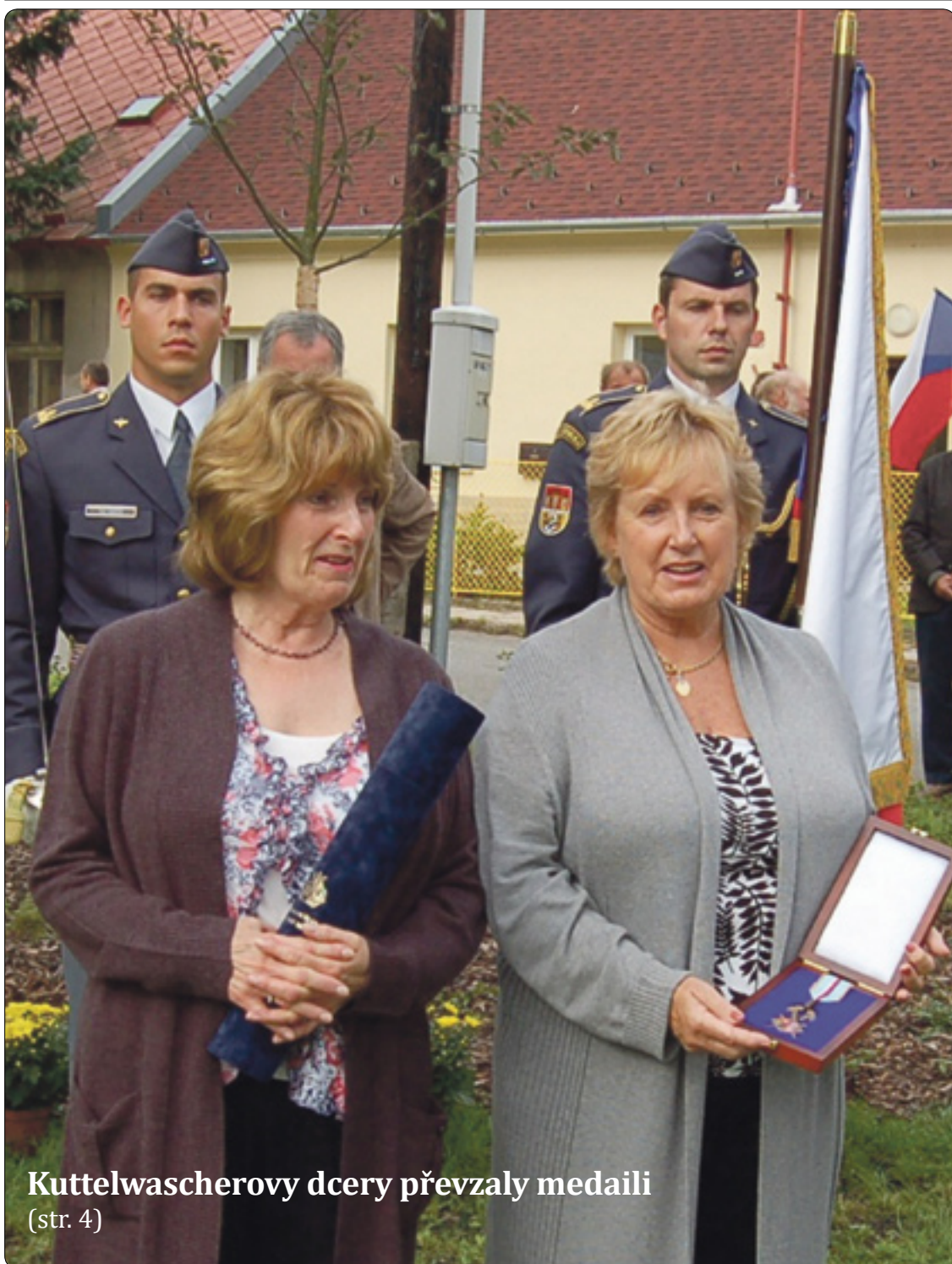
Kuttelwascherovy dcery převzaly medaili (str. 4)