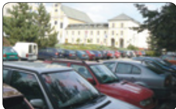
Beseda o parkovacím domě (str. 3)