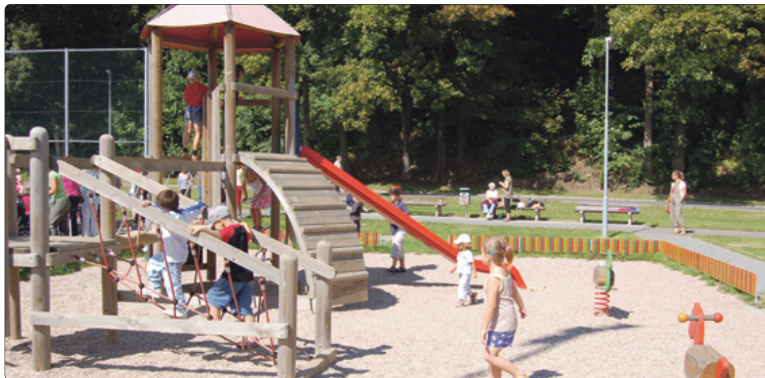
V oblíbenosti by patrně byl na prvním místě areál veřejných sportovišť Plovárenská, který vznikl ve dvou etapách. Jen jeho dokončení ve druhé etapě stálo 10 mil. Kč.

Díky dotacím EU bylo v září (roku 2010) otevřeno dětské hřiště pro malé děti s měkkým umělým povrchem. Doplnily jej prostory pro basketbal, házenou, malý fotbal, tenis a volejbal, prvky pro skateboard, a také příjemná relaxační zóna s lavičkami pro odpočinek. Investice za 6,6 mil. Kč byla ze 70 % doto-