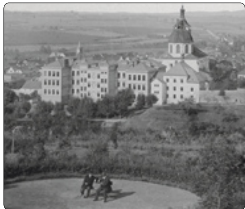
Budova nové školy s býv. kaplí na tehdejším Jirsíkově náměstí tvořila při pohledu z parku novou nepřehlédnutelnou dominantu města.

Seriozní diskuze o řešení stavu školských zařízení se na pořad obou městských orgánů dostala přibližně v polovině 80. let 19. století. Co činovník to jiný názor, všechny však spojovala snaha co nejvíce ušetřit městskou pokladnu od velkých vydání. Uvažovalo se o zbourání staré partikulární školy a jednoduché přístavbě k sv. Barboře, opravě „Barborky“ a výstavbě nové školní budovy jinde ve městě. Navrhovalo se například postavit ji u mostu v místě pozdějšího okresního domu, V rámech či na tzv. spáleništi v sousedství tehdejšího sirotčince v dnešní ulici Příčné. Zřejmě první, kdo přišel s radikálním a na zdejší poměry poněkud velkorysým řešením, byl počátkem r. 1886 Josef Šupich, který doporučoval místní školní radě všechny dosavadní školní budovy za děkanským kostelem zbourat a na jejich místě „s rozšířením do valů a Menšíkovy zahrady“ vybudovat novou moderní školu. Bylo to řešení elegantní, v duchu doby splňující všechny požadavky na vzdělávací ústav, leč drahé. Varianty