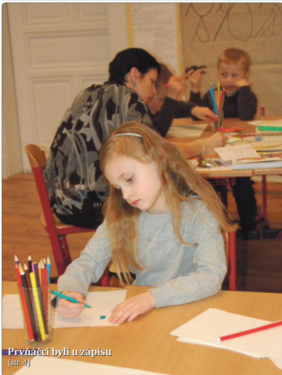
Prvňáčci byli u zápisu (str. 4)