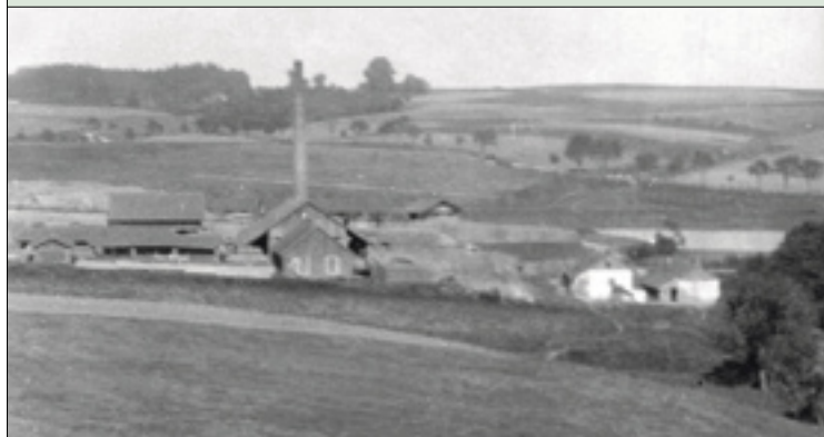
Snímek Šupichovy cihelny u Chotěbořské silnice z roku 1920 (SOKa Havlíčkův Brod, sbírka fotografií, sign. F 12/24) reprofoto PhDr. L. Macek