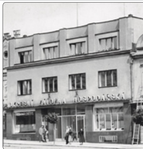
Budova hospodářské záložny zaujala parcely dvou původních měšťanských domů (r. 1938)

Záložna se sice zpočátku proti postupu města odvolala k zemskému úřadu, ale záhy změnila taktiku. Odvolání stáhla a postupnými kroky spojenými s žádostmi o změny v projektu se snažila realizovat původní záměr. Ani městské radě nebyla celá táhnoucí se záležitost příjemná, zvláště v roce, kdy se připravovaly mohutné oslavy 200 let gymnázia,