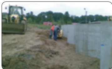
Sběrný dvůr u Cihláře bude vylepšen (str. 3)