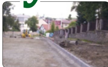
Investice a jejich „připravenost“ (str. 9)