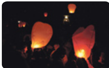
Valentýnská přání letěla do nebe (str. 5)