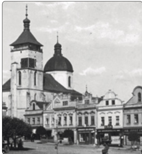
Severovýchodní roh náměstí před stavbou budovy okresní hospodářské záložny (počátek 30. let 20. století)

Historie hospodářských záložen je však daleko delší a úctyhodnější a má svůj počátek v 18. století v době tereziánských a josefinských reforem, kdy vznikaly v centrech panství tzv. kontribuční (kontribuční) sypky, v nichž se ukládaly přebytky obilí pro případ neúrody. Naturální forma byla později převedena na peněžní, až se z nich vyvinuly v 60. letech 19. století kontribuční záložny, které však většinou kopírovaly území bývalého panství, byly příliš malé a kapitálově nedostatečné. Proto také došlo alespoň v Čechách k jejich zásadní reformě v r. 1882. Poměrně pozdě, až