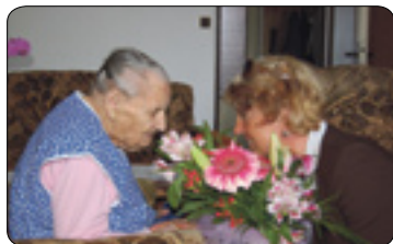
Stoletá paní bydlí v Havlíčkově Brodě (str. 4)