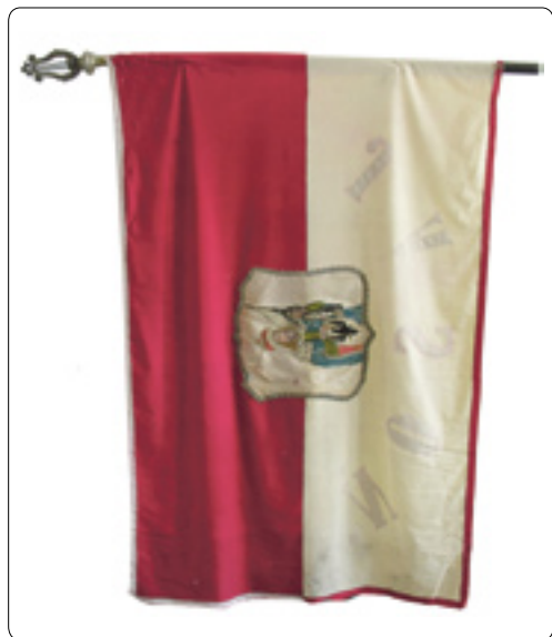
Zanedlouho budou moci prapor obdivovat návštěvníci výstavy k 150. výročí trvání spolku v Muzeu Vysočiny v Brodě