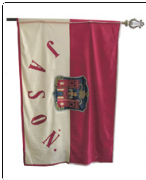
Vyšívání znak města na líci a obraz sv. Václava na rubu byly podle tradice na prapor Jasonů přeneseny z někdejšího praporu národní gardy z r. 1848

Slavnost to byla do té doby ojedinělá a hojností hostů i publika na místní poměry impozantní. Své kolegy přijeli podpořit pěvci z Chrudimi, Ledče nad Sázavou, Polné, Chotěboře, Přibyslavi, Humpolce, Pelhřimova, Jihlavy, Čáslavi, ba i členové pražského Hlaholu se zúčastnili. Vše začalo