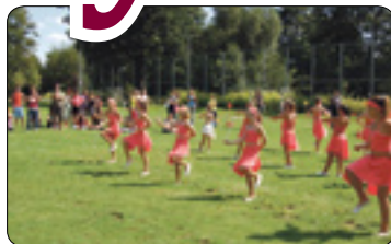
Konec prázdnin na Plovárenské (str. 4)