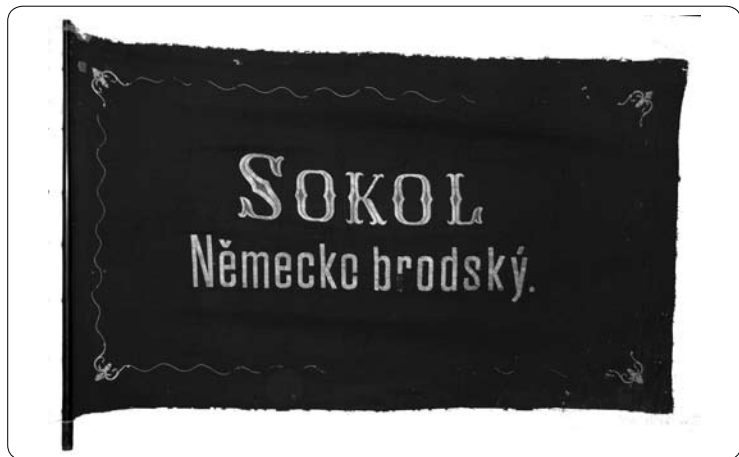
Prapor německobrodské jednoty, nyní uložený v brodsčém Muzeu Vysočiny