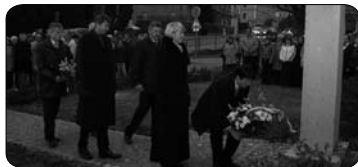
90 let ČSR (str. 5)