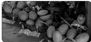
Bramboráři slavili 100 let (str. 5)