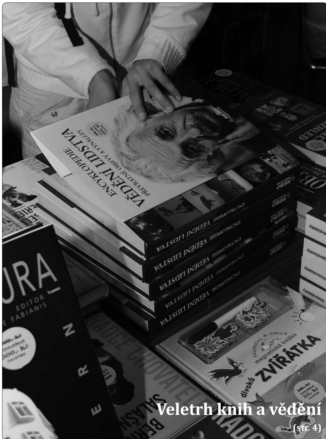
Veletrh knih a vědění (str. 4)