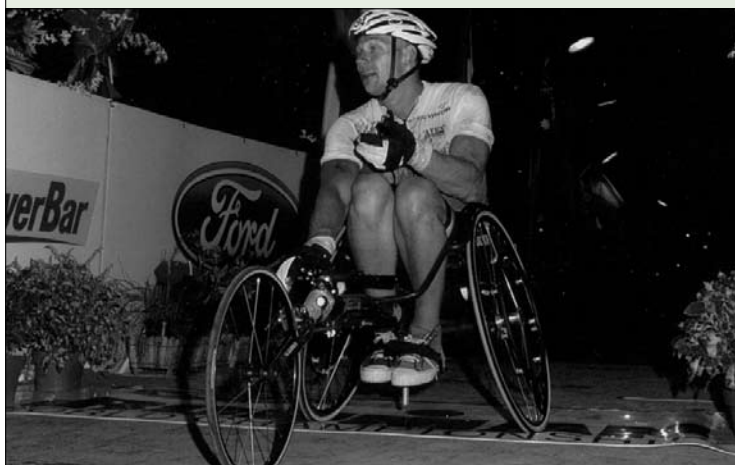
foto z cíle