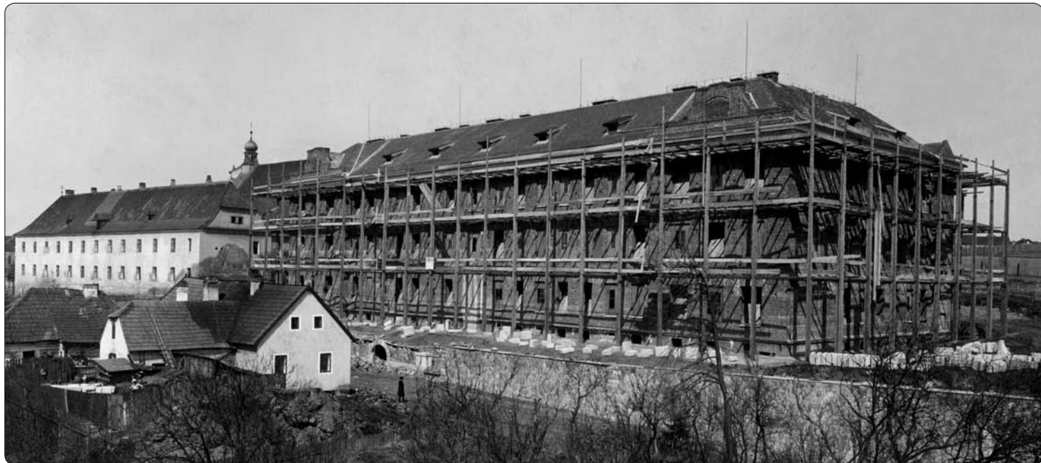
Někdejší gymnazijní budova rostla jako z vody. V současnosti zde sídlí ZŠ Štáflova.