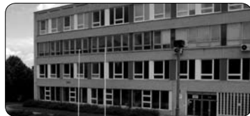
Opravy ve školách (str. 3)