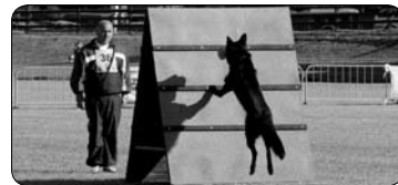
Jaromír Vácha (str. 13)