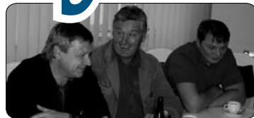
Spartak Moskva v Brodě (str. 7)