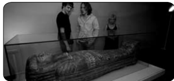
Egypt v Muzeu (str. 4)