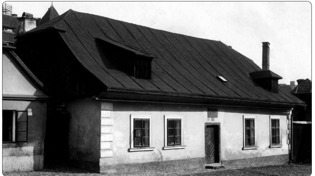
Rodný dům historika Jana Františka Beckovského na Smetanově nám. ve třicátých letech 20. století.

Jakkoliv bylo hodnocení Beckovského díla v oficiální historiografii v různých dobách a z různých pozic rozporuplné, ani největší kritici mu nemohli upřít zásluhy o udržení národního vědomí o vlastní historii a tím i posílení vědomí