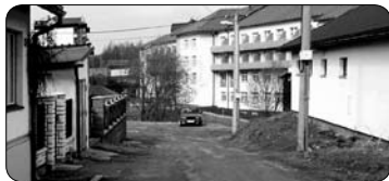
Rekonstrukce Vagonové kolonie (str. 3)