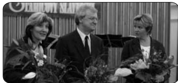
Stamicovy slavnosti 2008 (str. 4)