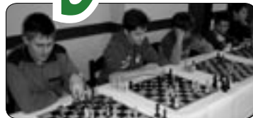
Mistrovství ČR v šachu (str. 7)