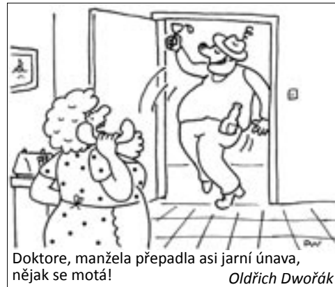
Doktore, manžela přepadla asi jarní únava, nějak se totá! Oldřich Dwořák