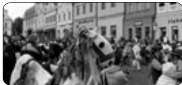
Masopustní jarmark (str. 4)