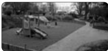
Hřiště na Kalinově nábřeží (str. 3)