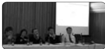
Diskuze o revitalizaci centra města (str. 2)