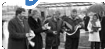
Slavnostní otevření terminálu (str. 5)