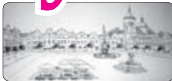
Havlíčkovské náměstí čeká rekonstrukce (str. 8)