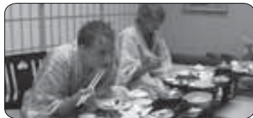
Junioři pétanque v Japonsku (str. 7)