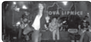
Rocková Lipnice (str. 4)