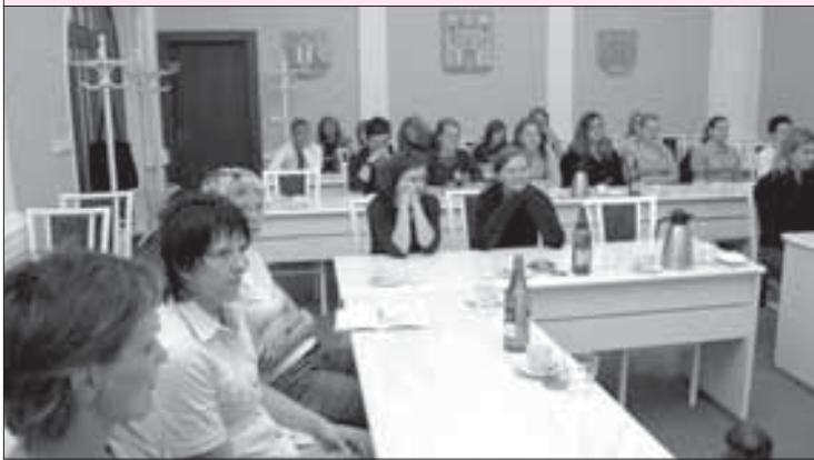
V červnu přijalo vedení města na radnici delegaci házenkářek TJ Jiskra. Ženy postoupily do I. ligy a starší žákyně byly 3. na Mistrovství ČR.