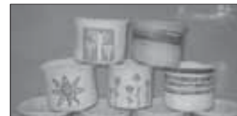
Fokus, moje druhá rodina str. 13