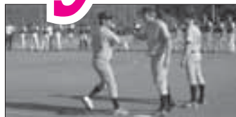
Světový pohár v softbalu str. 7