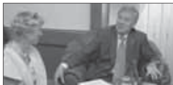
Finský velvyslanec v Brodě str. 5