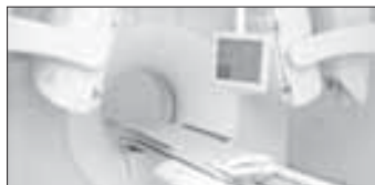
Nová gamakamera str. 4