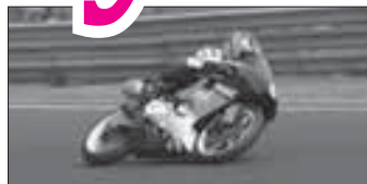
Mistr ČR v silničním závodě str. 7