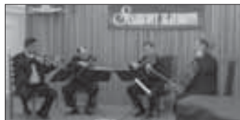
Stamicovy slavnosti str. 5