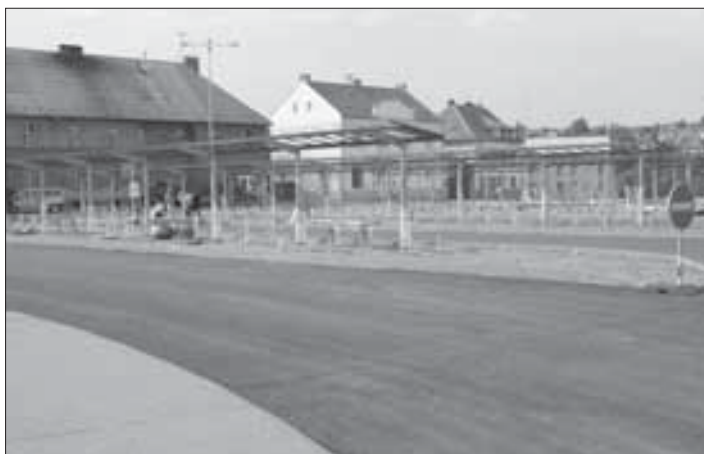
Autobusový terminál roste za slunného počasí jako tráva po dešti.