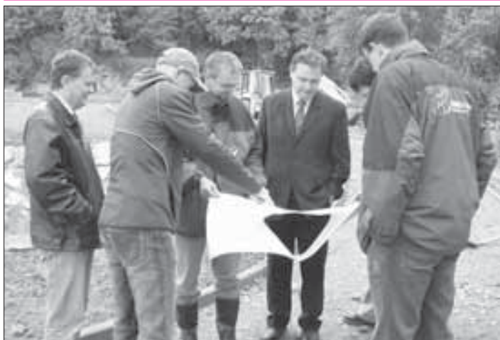
Na Plovárenské proběhl kontrolní den. Dokončení I. etapy nás čeká už v červnu.