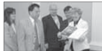
Osobnost měsíce str. 13