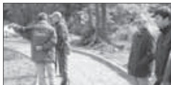
Veřejné hřiště už v červnu str. 3